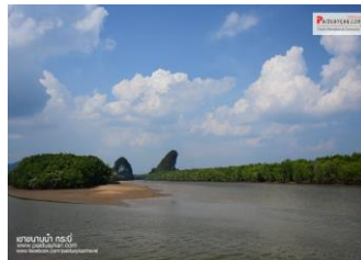
๘.เขานาบน้ำ