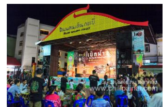
๑๒.ถนนคนเดิน