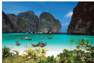
๑๑.อ่าวมาหยา