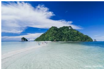
๔.หาดถ้ำพระนาง