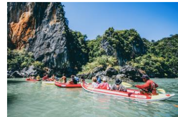
๙.เกาะสองห้อง