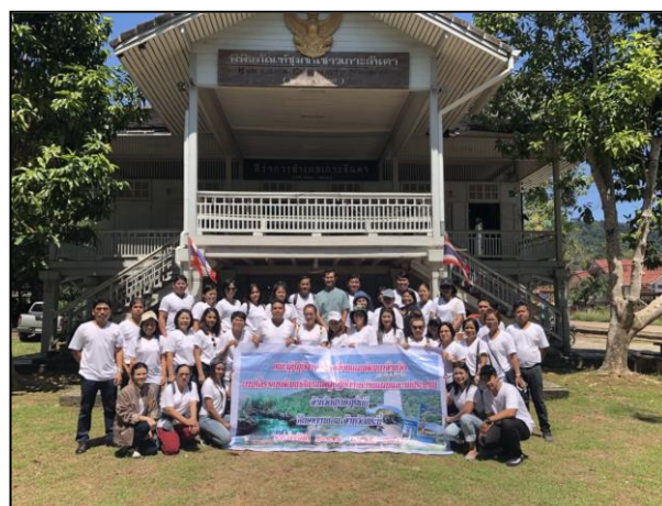
คณะศึกษาดูงานพิพิธภัณฑ์ชุมชนชาวเกาะลันตา