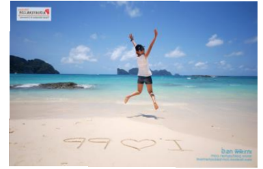
๓.เกาะพีพี