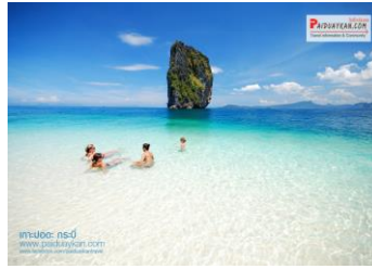
๒.เกาะปอดะ