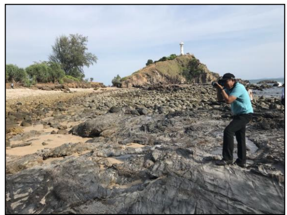
คณะศึกษาดูงานอุทยานแห่งชาติหมู่เกาะลันตา

๔. พิพิธภัณฑ์ชุมชนชาวเกาะลันตา มีแนวคิดในการจัดทำพิพิธภัณฑ์ คือ การที่คนในชุมชน เริ่มมองเห็นคุณค่าทางสถาปัตยกรรมของอาคารที่ว่าการอำเภอเกาะลันตาหลังเก่า ที่สร้างขึ้นตั้งแต่สมัยรัชกาล