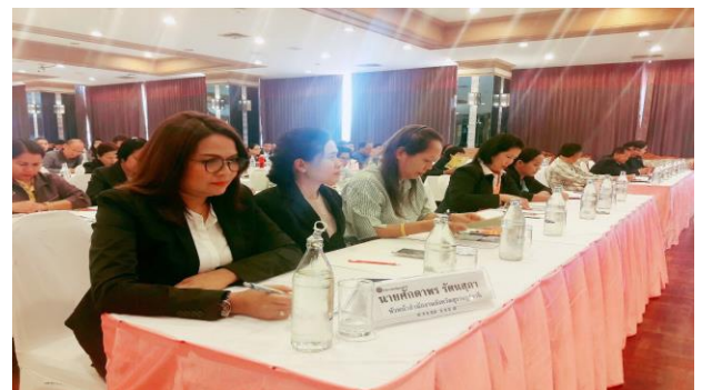
ผู้เข้าร่วมการอบรมเชิงปฏิบัติการข้าราชการผู้ปฏิบัติงานขับเคลื่อนแผนพัฒนาจังหวัด