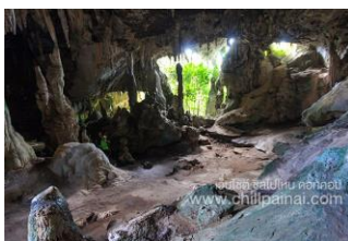
๑๐.ถ้ำผีหัวโต