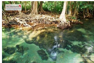
๕.ทำปอมคลองสองน้ำ