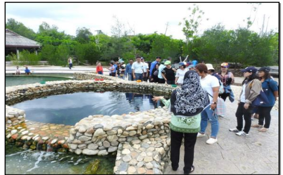
คณะศึกษาดูงานน้ำพุร้อนเค็มคลองท่อม