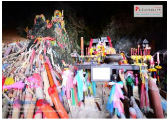
๑.ทะเลแหวก

กระบี่ อีกหนึ่งเมืองท่องเที่ยวทางทะเลยอดนิยม ซึ่งพื้นที่ส่วนใหญ่ ประกอบด้วยภูเขา ที่ราบ หมู่เกาะ น้อยใหญ่กว่า ๑๓๐ เกาะ อุดมไปด้วยป่าชายเลน มีสถานที่ท่องเที่ยวต่าง ๆ ที่มีความงดงามมากมายชวนให้หลงใหลไม่ว่าจะเป็นหาดทรายที่ขาวละเอียด น้ำทะเล ใสสีฟ้าคราม และหมู่ปะการังอันงดงาม ไม่เพียงแต่สถานที่ท่องเที่ยวทางทะเล แต่บนฝั่งนั้นยังมีที่เที่ยวยุทธศาสตร์สุด Unseen อีกหลายแห่ง ทำให้นักท่องเที่ยวหลายคนต่างอยากมาชื่นชมมนต์เสน่ห์กันมากมาย