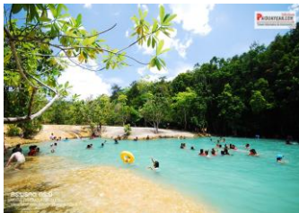
๗.สระมรกต