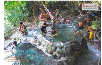
๖.น้ำตกร้อนกระบี่